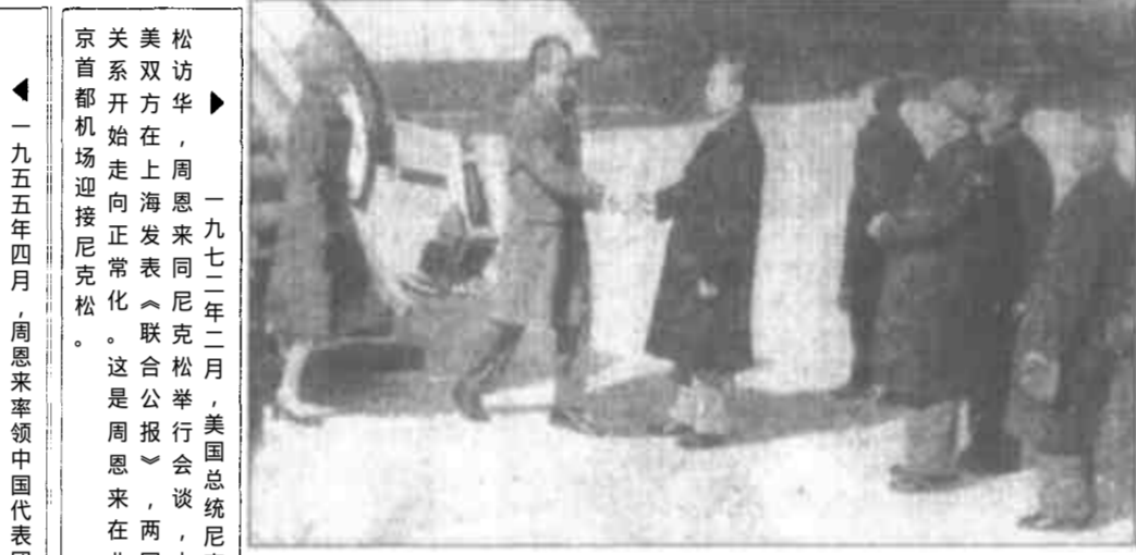
▶一九七二年二月，美国总统尼克松访华，周恩来同尼克松举行会谈，中美双方在上海发表《联合公报》，两国关系开始走向正常化。这是周恩来在北京首都机场迎接尼克松。