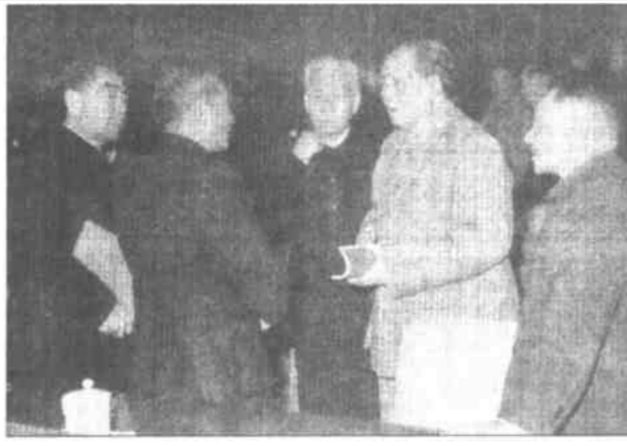
▲1962年，周恩来和毛泽东、刘少奇、朱德、陈云、邓小平等在中共中央工作会议上。