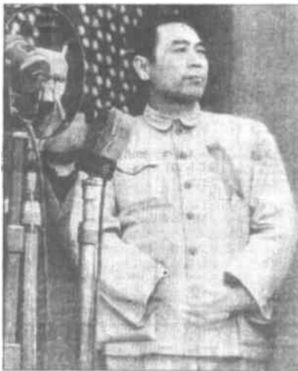
▲一九四九年十月一日，周恩来在北京天安门城楼上参加中华人民共和国成立大典。同日，在中央人民政府委员会第一次会议上，周恩来被任命为政务院总理兼外交部长。