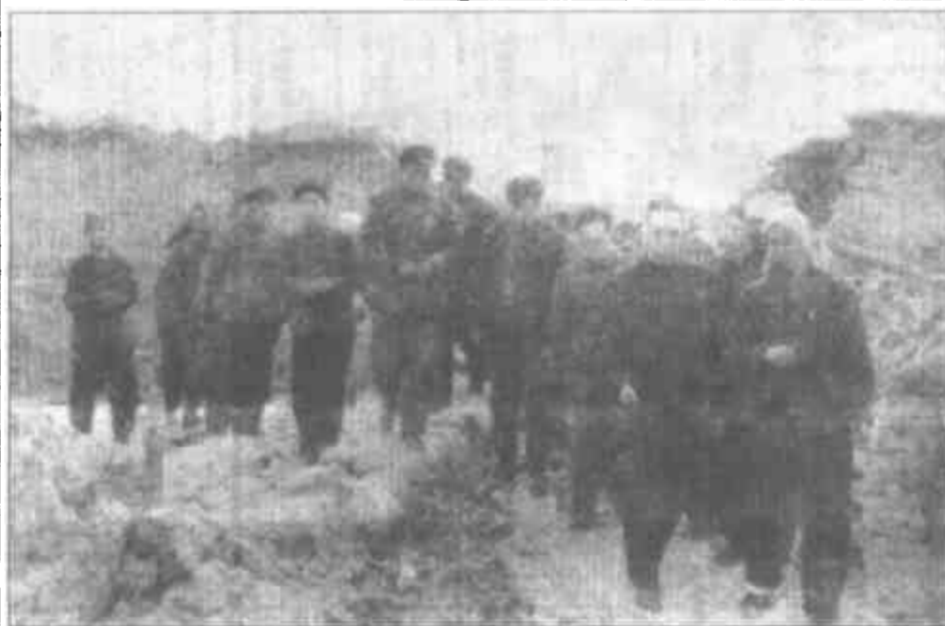
1966年3月8日，河北省邢台地区发生强烈地震。第二天，周恩来总理就赶往灾区了解情况，慰问受灾群众，鼓励灾区人民以愚公移山的精神，奋发图强、自力更生、发展生产、重建家园。