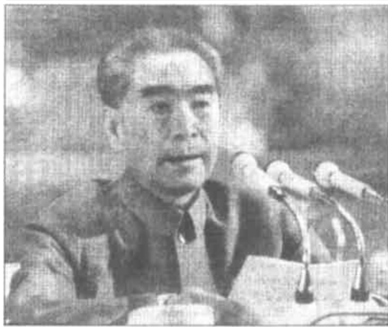
▲一九七五年一月，周恩来总理在全国人大四届一次会议上抱病作《政府工作报告》，向全国各族人民重申实现“四个现代化”的宏伟目标。