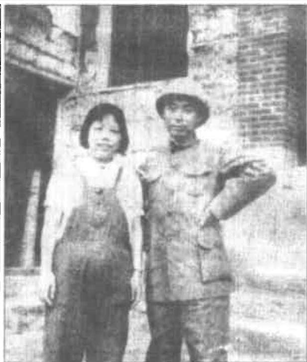
▶1939年，周恩来同邓颖超在重庆红岩八路军办事处。抗日战争时期，周恩来长期在国统区主持中共中央南方局和统一战线的工作。