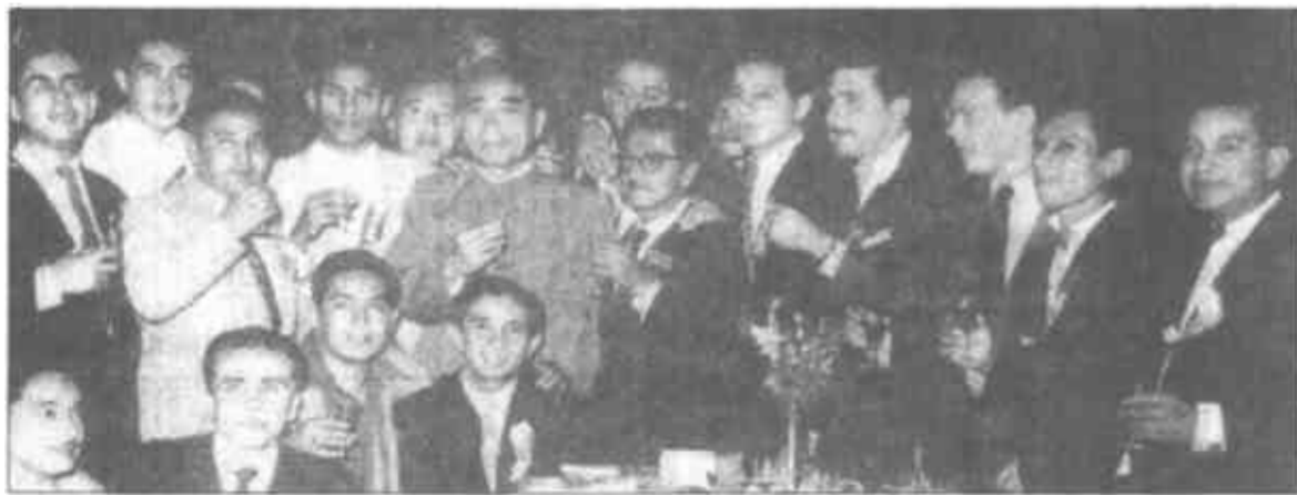
周恩来和出席国际学联代表大会代表欢聚在北京。