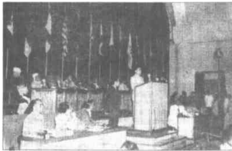
▲一九五五年四月，周恩来率领中国代表团出席在印度尼西亚的万隆市召开的首届亚非会议。周恩来倡导的和平共处五项原则和“求同存异”方针，促使会议获得圆满成功。