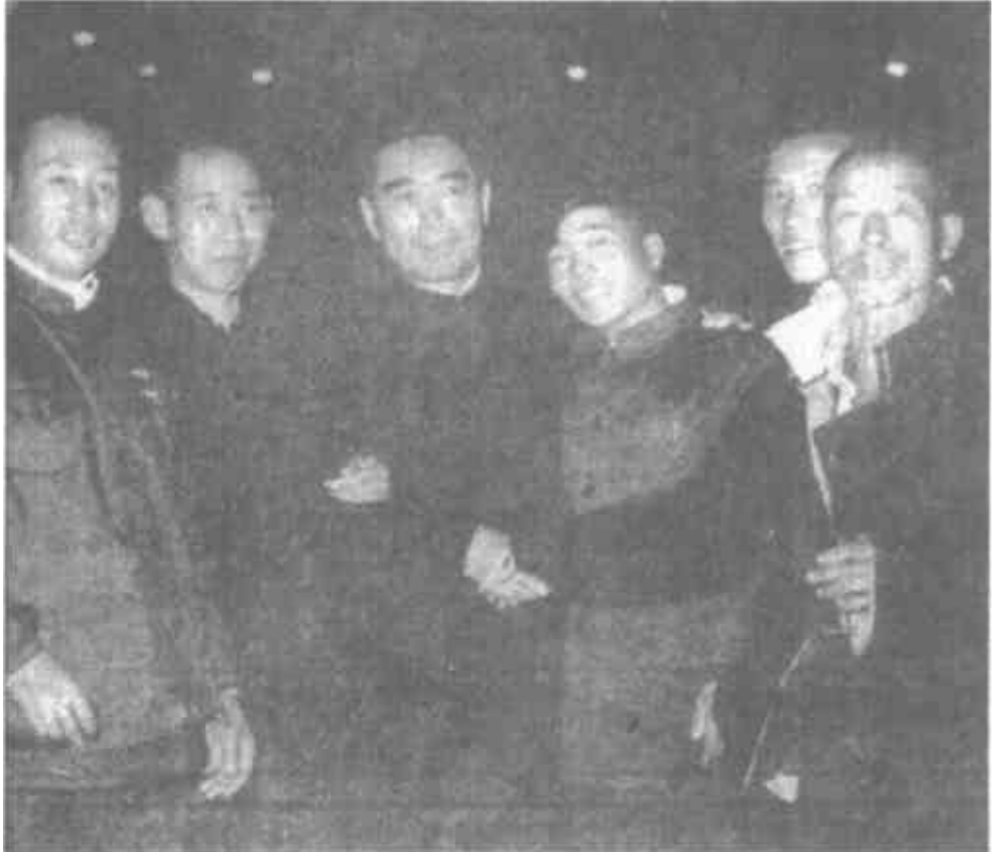
▲周恩来和北京郊区农民在一起。